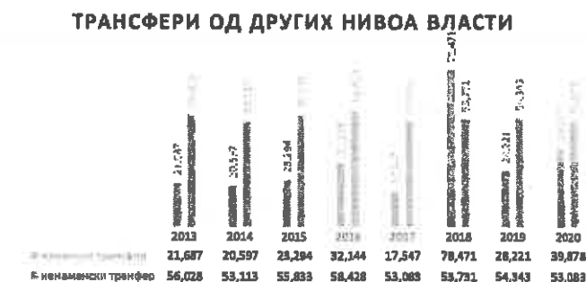
Издржи буџета, по основним наменавима, утичани су и репортирани у следећим износима и то: