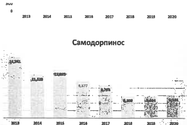
Кретање појединих уступљених прихода и трансфера у периоду 2013-2020 (јан-сеп)