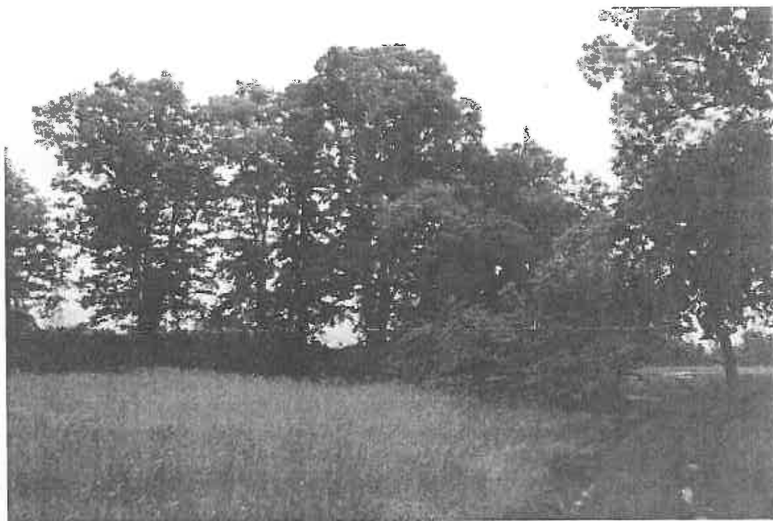
Сл. 3: Стабла храста лужњака у Парку у Хоргошу 2014. године

Старо стабло софоре ( Sophora japonica L.) је нарушене виталности и естетике.