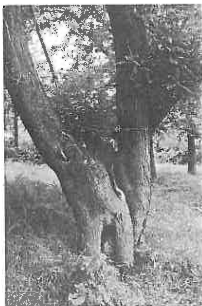
Сл. 4: Солитерно стабло софоре 2014. године

Старо стабло софоре ( Sophora japonica L.) је нарушене виталности и естетике.