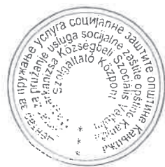
Tolnai Csaba - Igazgató